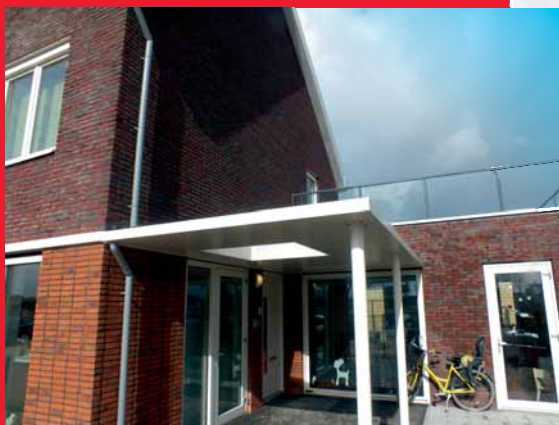
Een strakke, enkele carport met lichtkoepel