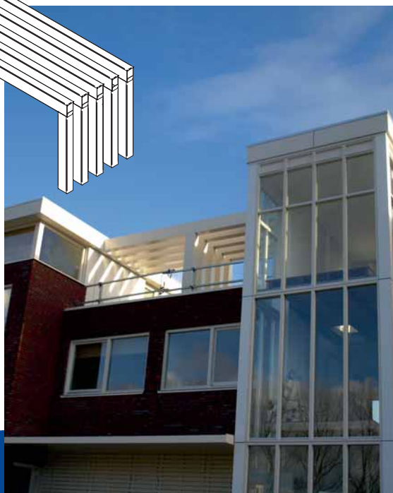
Strakke aluminium pergola tussen de woningen in.

Meilof Rijs bv heeft bij de eerdere projecten van Rottinghuis de aluminium goten geplaatst. Tijdens een gesprek met de heer G. Spa van Meilof Rijs bv, over deze projecten werd duidelijk dat Meilof Rijs bv veel meer kan dan alleen goten leveren. De heer Vogelzang heeft op dat moment de tekeningen van het destijds nieuwe project '16 woningen Het Eiland' aan de heer Spa meegegeven en gevraagd eens te kijken naar de mogelijkheden die Meilof Rijs bv kon bieden op het gebied van omkaderingen, luifels en pergola's - elementen die allemaal aan de orde zijn bij Het Eiland te Helpermaar.