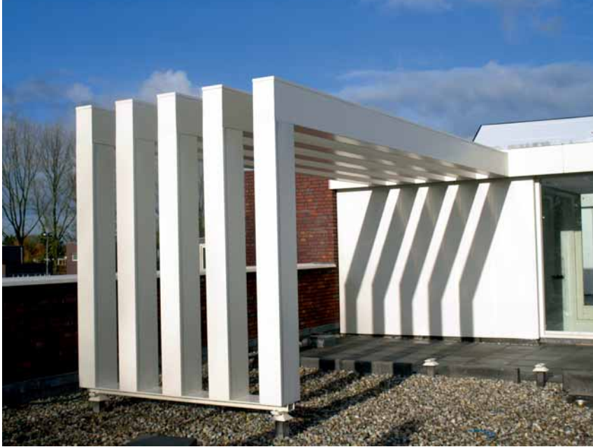
Onderhoudsarme aluminium pergola.

Rottinghuis is sinds 1931 als aannemingsbedrijf gevestigd in Groningen. Het bedrijf heeft zich in de loop van de jaren ontwikkeld tot een toonaangevend allround bouwbedrijf, dat opereert in het noorden van ons land. Rottinghuis maakt deel uit van VolkerWessels en realiseert met circa 100 medewerkers een omzet van ruim 40 miljoen euro.